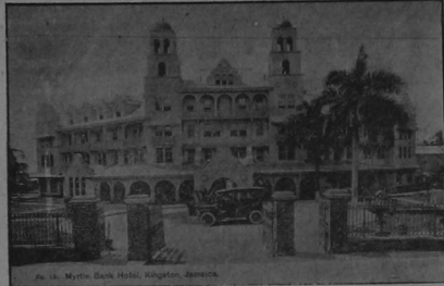
UN HERMOSO EDIFICIO EN KINGSTON