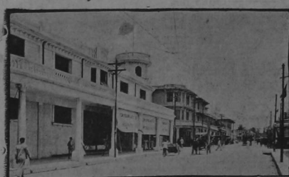
CALLE DEL REY EN KINGSTON